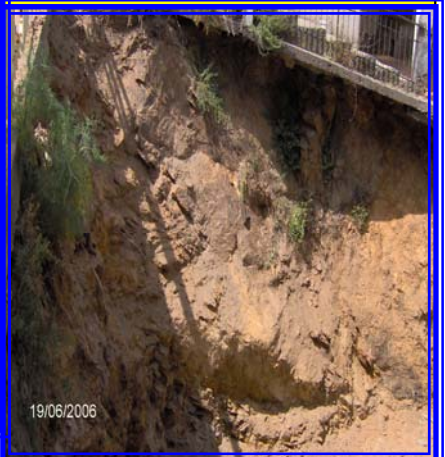
Consolidamento via Casale.