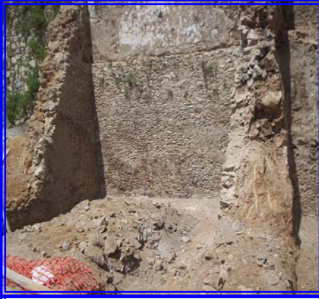
Consolidamento di Via Corrado Alvaro, demolizione del rudere pericolante e consolidamento mediante palificazione.