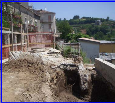
Consolidamento di Via Garibaldi interessata da Cedimenti del Terreno

Interventi di Consolidamento e Riqualficazione di Via Garibaldi, Via Casale, Via Corrado Alvaro. Ditta Esecutrice: ILAN S.R.L u. di Torchia Angelo